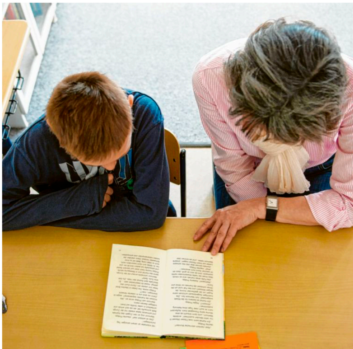
Lern- und Lesepaten helfen Kindern, die Probleme in der Schule haben. Das soll ohne Stress und Notendruck geschehen. Die Ergebnisse sind beachtlich.